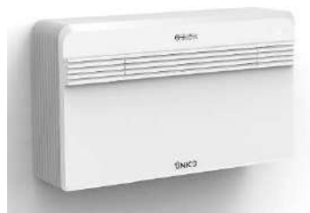
Impianto di raffrescamento